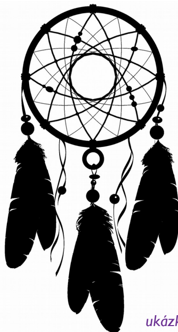
ukáзка lapače snů